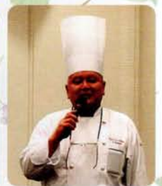
トーヨーホテル 料理長