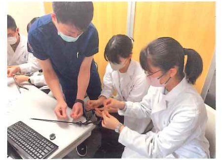
富良野協会病院での地域医療体験