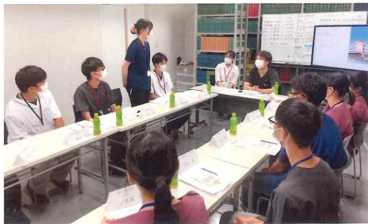
勤医協一条通病院での医師体験

地域医療体験（名寄市立病院・富良野協会病院） 1日医師体験（勤医協一条通病院） 1日教育実習（旭川市内小学校） ふれあい看護体験（旭川市内病院）など