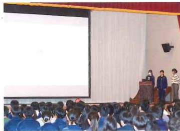
アカデメイアのポスターセッション（1年）