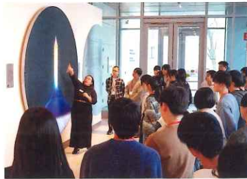
アメリカボストン研修

長期休業日を利用して、海外との交流を行います。希望者を対象とした アメリカボストン研修（9日間）や、校内でのグローバルスタディ研修（3日間）を実施します。