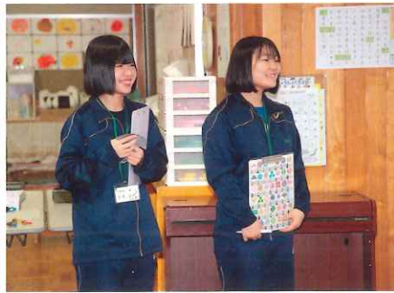
朝日小学校での1日教育実習